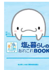
塩と暮らしのあれこれ BOOK