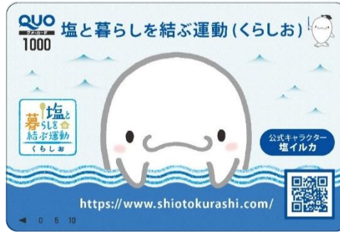
オリジナル QUO カード