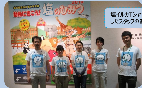
塩イルカTシャツを着用したスタッフの皆さん

博物館で動物と塩の関わりを学んだあとは、冊子を読んで、人間の暮らしと塩の関わりについても、ぜひ学んでいただきたいと思います。