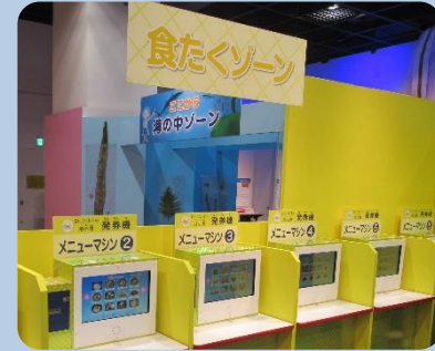
「さぐってみよう！海のみぐみ」の会場