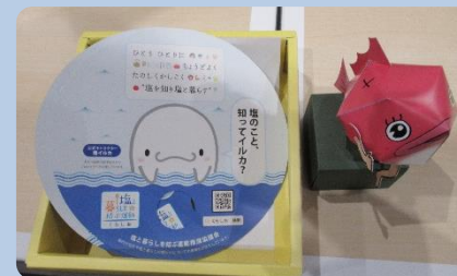
左：ウチワとペーパークラフト 右：『塩と暮らしのあれこれBOOK』