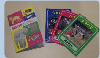
左：「おはなしマシン」で動物の話が聞けます。 右：正解すると貰えるカードとカードケース